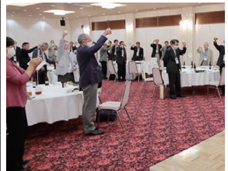
▲親睦を深めた懇親会

※会則、令和3年度収支決算、事業報告、令和4年度収支予算、事業計画等の詳細等、総会資料はこちらから▶