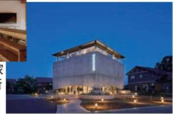
▲越後薬草蒸留所 設計: 東海林健建築設計事務所