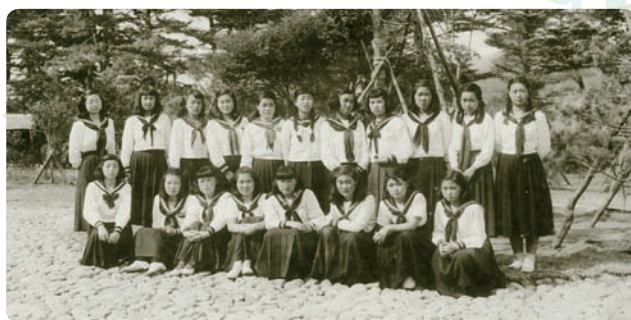
▲裏山にて女子1期生19名

注(女子一期生のあれこれについて興味のある方は「あをくも第172号」、その他の記念誌に詳しいので、それちらをご覧くださいませ)