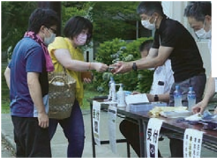
▲職員玄関前で受付