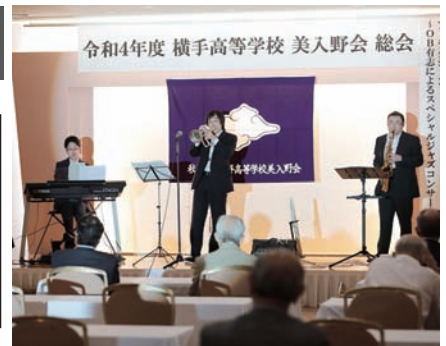
▲参加者を魅了したコンサート