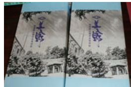
▲完売となった校章入り菓子