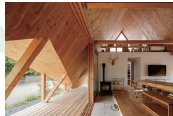
▲hara house / 中之島の家 設計: 東海林健建築設計事務所