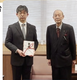
▲校長室にて贈呈式