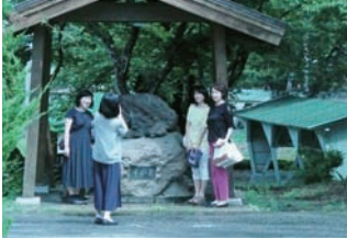
▲雲居の泉で記念撮影