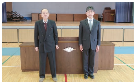
▲贈呈した演台一式と花台二台

演台と花台は令和4年度の卒業式で早速ご使用戴いたと伺っております。演台一式を、末長くお使い戴ければ幸いです。